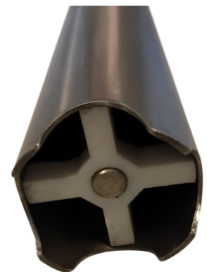
Succión abierta ø 2" para pasaje de semisólidos