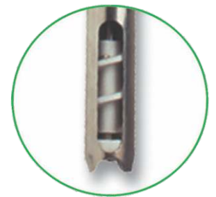
Impulsor rotor tornillo helicoidal

Succión abierta ø 2" para pasaje de semisólidos