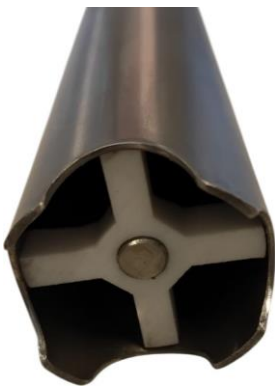
Succión abierta ø 2" para pasaje de semisólidos